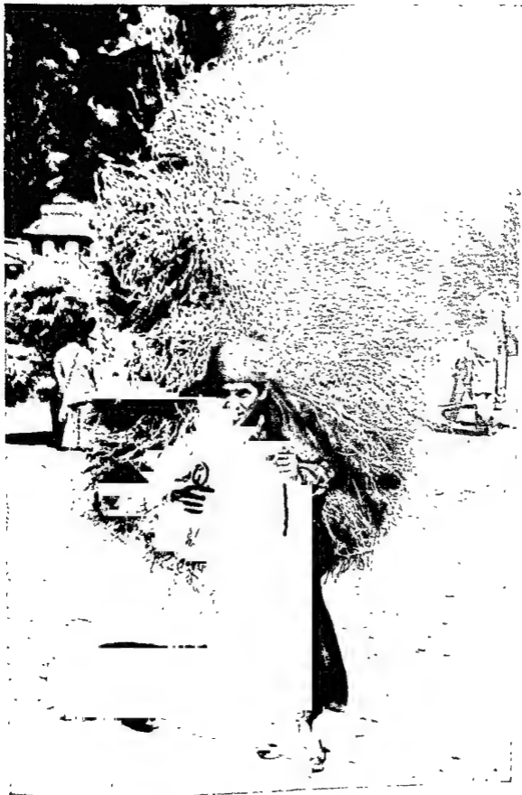
पगडों के लिए चारा ढोते हुए